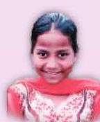
Sis. Sugantha Shalom Charity Trust