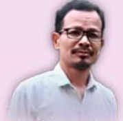
Pr. Dhananjay Nokman Assam