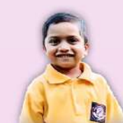
Bro. Joshua Bhuriya Shalom Charity Trust