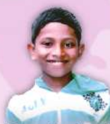
Bro. Prakash Shalom Charity Trust