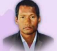
Pr. Prasenjit Basumatary Assam